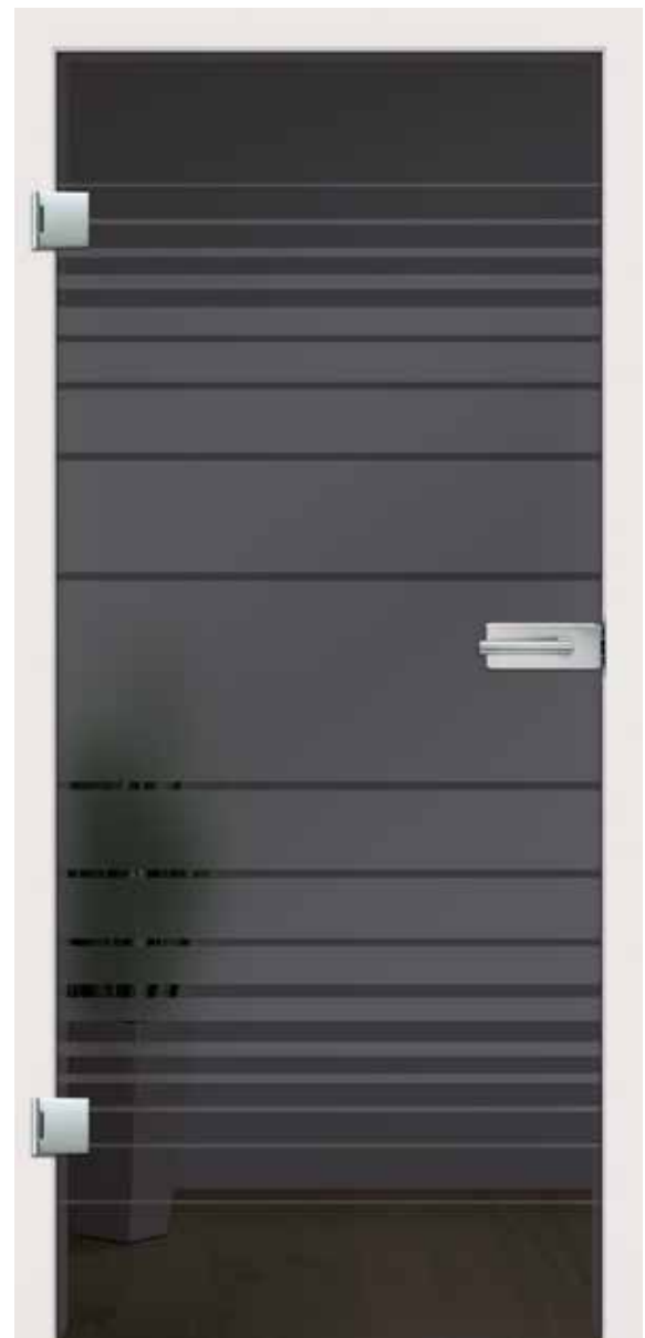
Luna Lava Grey, Motiv matt/Fläche klar