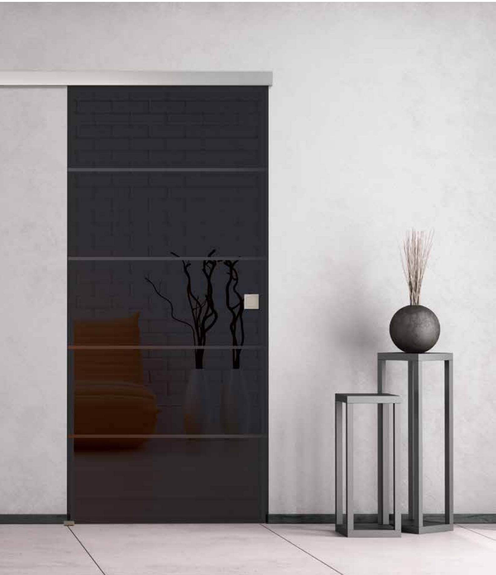
Schiebesystem: Pari 2.0, ähnl. Edelstahl matt | Glasdesign: Trenta Lava Grey, Streifen matt/Fläche klar | Griffmuschel: eckig, ähnl. Edelstahl matt