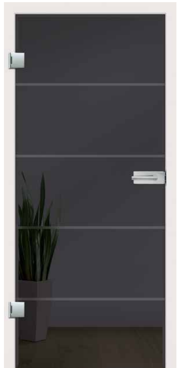
Trenta Lava Grey, Streifen matt/Fläche klar