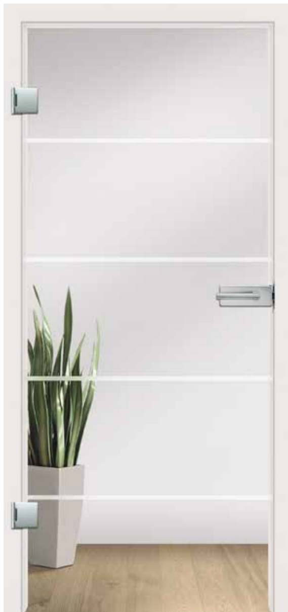
Trenta Classic White, Streifen matt/Fläche klar

So verschieden wie Menschen und ihre Wohnräume, so unterschiedlich erscheinen Lava Grey und Classic White. Setzen Sie Akzente und erleben Sie reizvolle Lichtspiele mit besonderen Gläsern – transparent, elegant und zeitlos im Design.