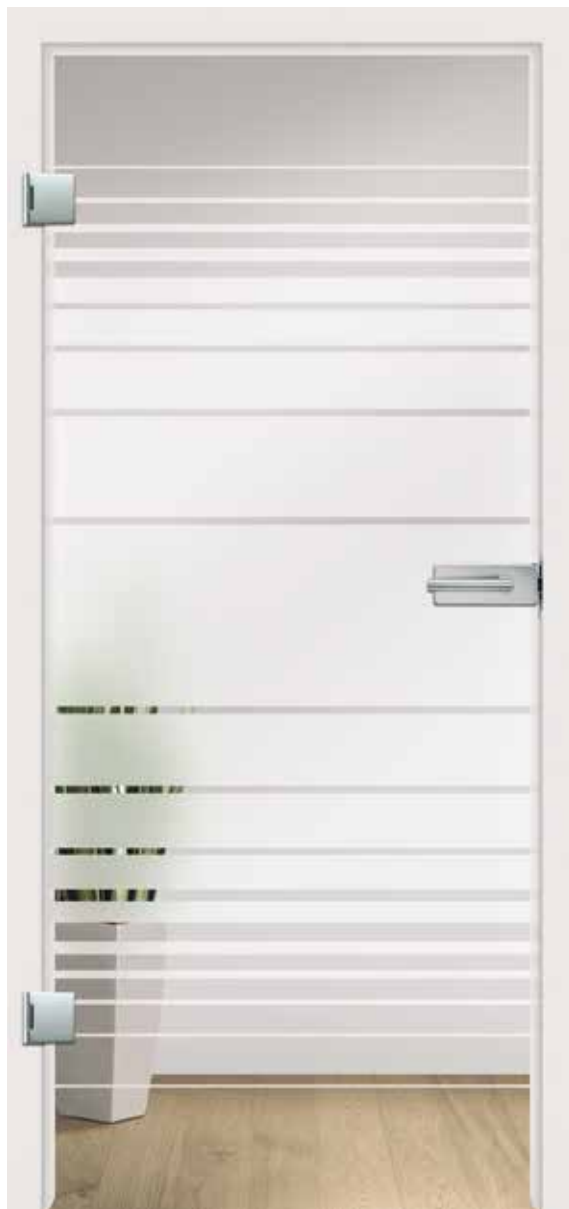
Luna Classic White, Motiv matt/Fläche klar

Im spannenden Spiel von Licht und Schatten trifft Lava Grey auf Classic White, dunkel auf hell, matt auf klar, kleine auf große Flächen. Schaffen Sie Ihr ganz eigenes Lichtspiel – zart und transparent oder mystisch und diffus.