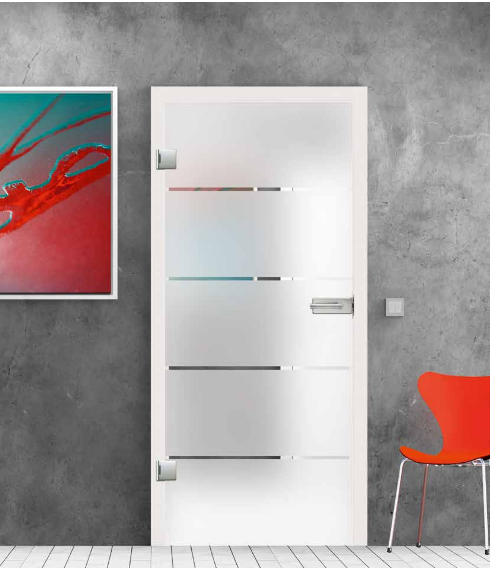
Drehtür 1-flg. | Glasdesign: Trenta Classic White, Streifen klar/Fläche matt | Beschlagset: Klassiker 2.0, ähnl. Edelstahl matt