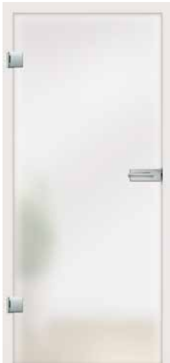
Satinato Classic White