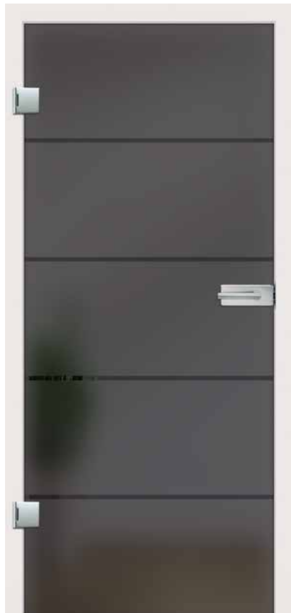
Trenta Lava Grey, Streifen klar/Fläche matt