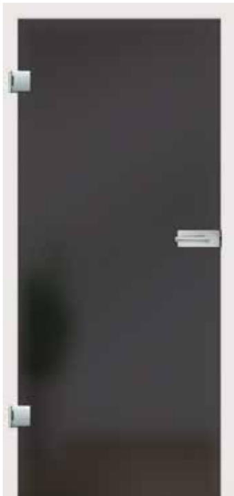
Satinato Lava Grey