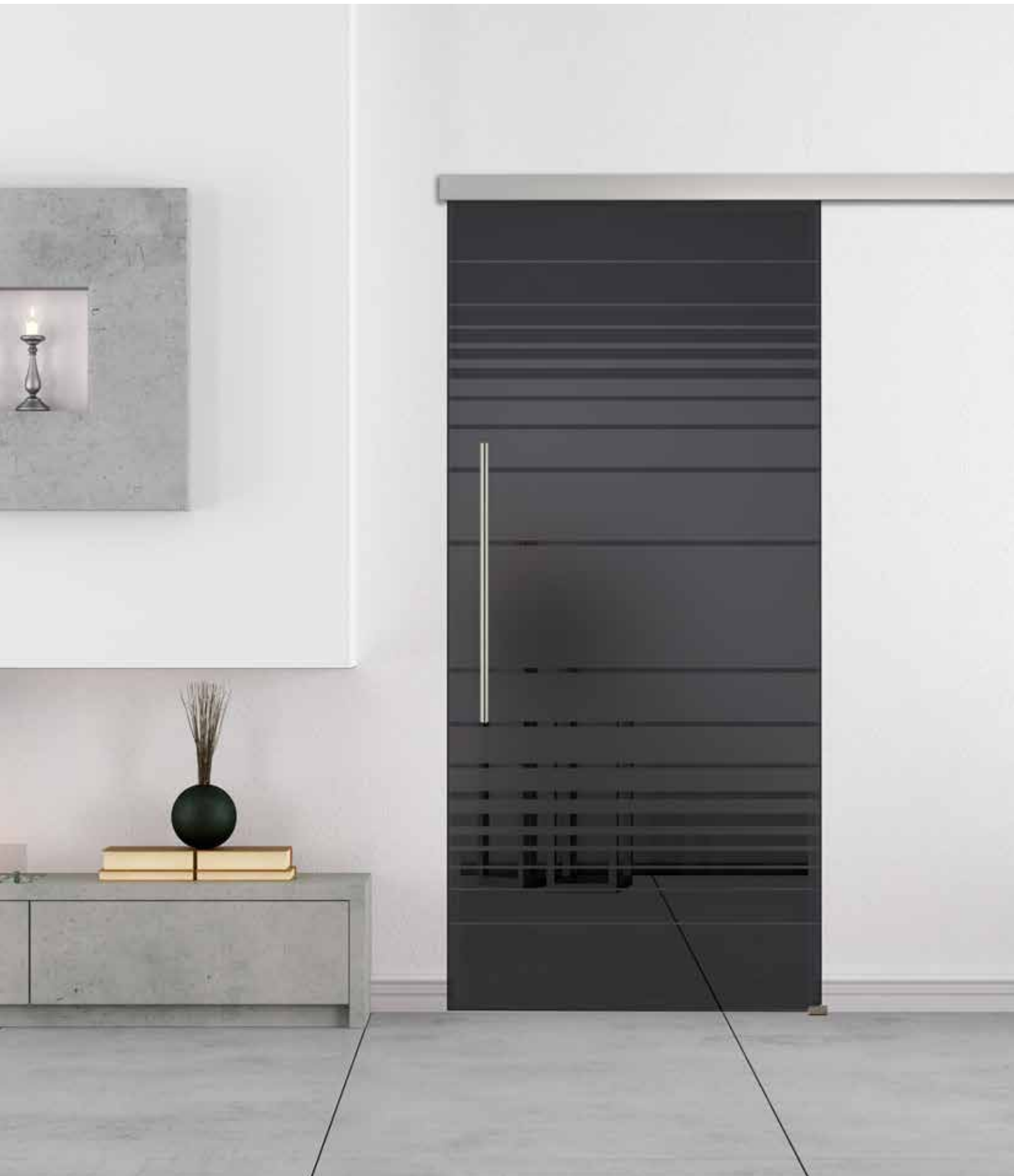
Schiebesystem: Pari 2.0, ähnl. Edelstahl matt | Glasdesign: Luna Lava Grey, Motiv matt/Fläche klar | Griffstange: rund G 700, Edelstahl matt