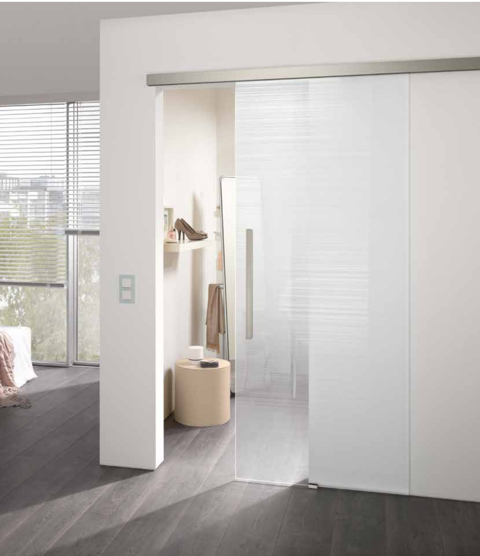
Schiebesystem 1-fig.: Pari 2.0, ähnl. Edelstahl matt | Glasdesign: Rigato Classic White | Griffliste beidseitig, 600 mm, ähnl. Edelstahl matt