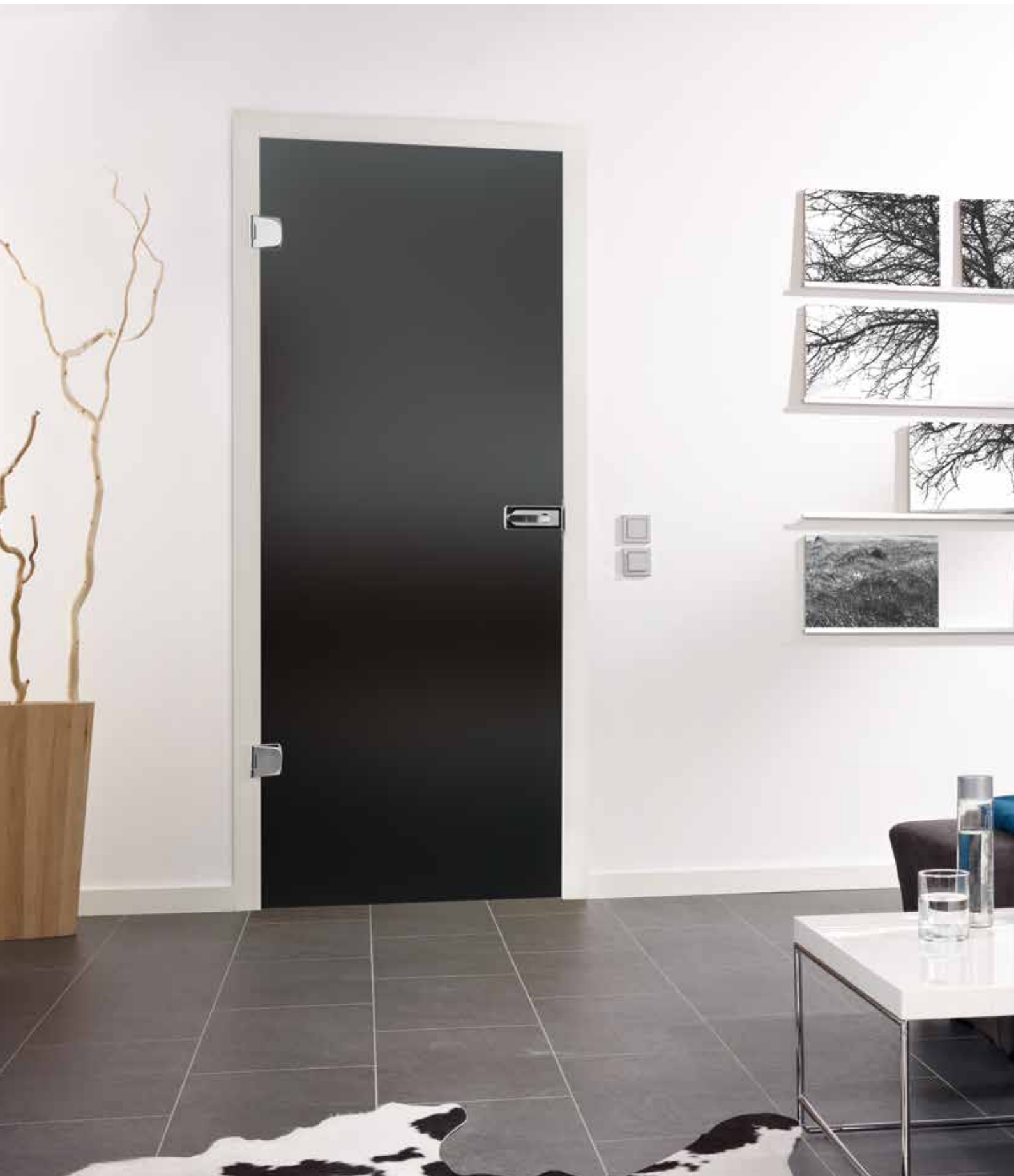
Drehtür 1-flg. | Glasdesign: Satinato Lava Grey | Beschlagset: Modern 2.0, ähnl. Chrom Glanz mit Inlay, weiß RAL 9010